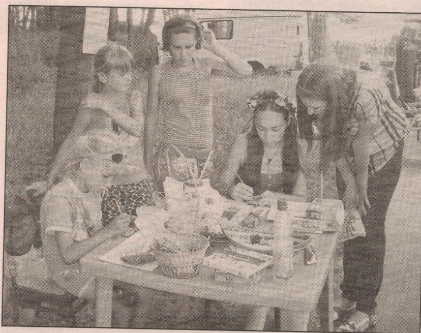
● В «Библиотечных заманухах» Ивнянской ДБ участвуют на все руки мастерицы

Имидж библиотеки повышается — жители села видят в её мероприятиях подлинное средство воспитания и образования будущего нации.