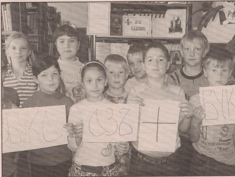
● Участники встречи «Азы православия — начало духовной безопасности» в Кочетовской модельной библиотеке в День славянской письменности и культуры

Она предназначена для создания позитивного имиджа ДБ как литературно-культурной среды посёлка. Приобщаясь к классической и качественной современной литературе, юные пользователи развивают свой творческий потенциал. Книга для них уже не только способ получения новых знаний, но и потребность. Активизировать же постоянных посетителей и привлечь новых можно путём расширения зон библиотечной работы.