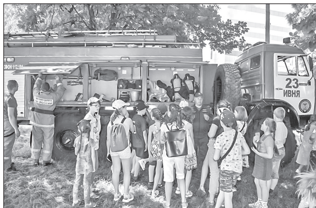
■ Кульминацией встречи со спасателями МЧС стало знакомство с их спецмашиной. Девчонки и мальчишки не обошли своим вниманием ни одну деталь и наперебой задавали вопросы гостям

Наш просветительский проект, как и любой другой, имел информационную поддержку. Проводились обзоры и беседы, оформлялись выставки, такие как «Соблюдайте правила дорожного движения», «Вода: опасная и безопасная», «Твоя безопасность — твоя жизнь», «Ориентир: здоровый образ жизни» (к Международному дню борьбы со злоупотреблением наркотическими средствами и их незаконным оборотом). Также мы подготовили и распространили среди детей