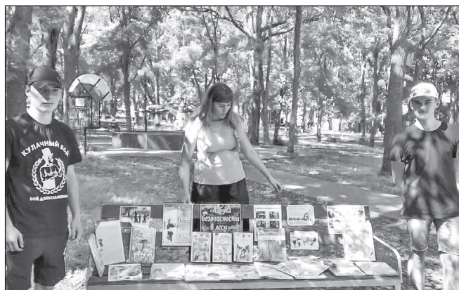
■ Летом так приятно пройтись по лесу! Но по пути стоит изучить издания с выставки, чтобы на прогулке не случилось беды

и взрослых разнообразные памятки. Среди брошюр — «Безопасность дома и на улице», «Какую опасность хранит водоём?», «Как не потерять ребёнка в лесу», «Правила поведения на природе», «Собирай только знакомые растения, ягоды и грибы».