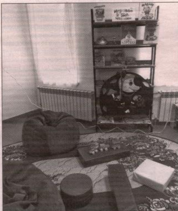
■ Самых маленьких читателей в игровом уголке ждёт яркая панель для развития мелкой моторики

Светильник «Вулкан» испускает бесконечное множество бликов, напоминающих снегопад или мелькание солнечных зайчиков. В сочетании со спокойной мелодией они создают ощущение сказки, героями которой становятся те, кто находится в комнате. Прибор