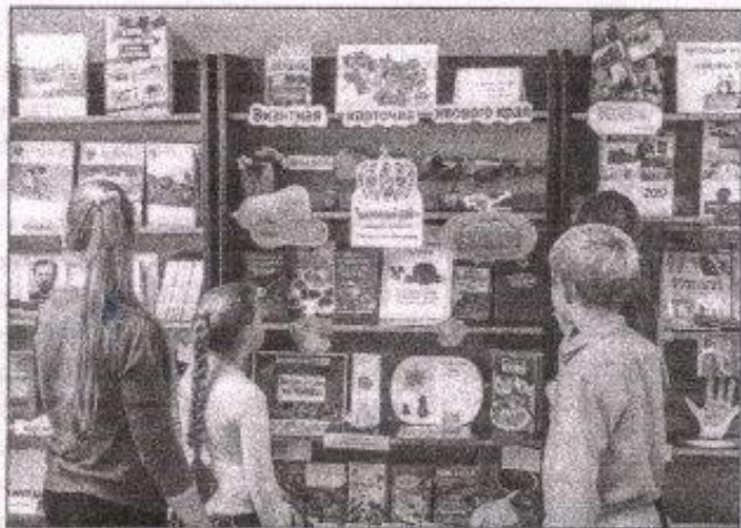
■ Сафоновское сельское поселение начинается с... тыквы. Именно она считается культурным брендом. Поэтому естественно, что одна из выставок МБ была посвящена яркому овощу

Детская библиотека стала любимым местом досуга юных читателей. У подростков популярна площадка «Создай своё будущее — читай!», где представлены различная литература и периодические издания о дружбе, профессиях, спорте. Здесь проходят «библиотечные тусовки», диспуты, комментированные чтения, обсуждения новинок и др. Подростки приходили и на мероприятия, и просто пообщаться и почитать. Привлекает внима-