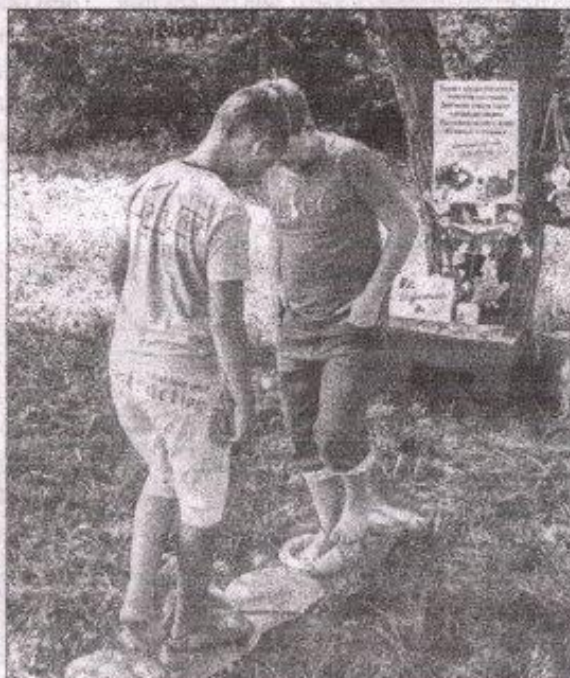
■ В непринужденной игре-путешествии «Сенсорной тропой в заколдованный лес» можно увлекательно пройти процедуру по профилактике плоскостопия

Особое внимание уделяют специалисты Детской библиотеки ребятам с ограничениями жизнедеятельности. Для них организуют литературно-игровые площадки. Сценарии мероприятий специально адаптированы: дети не только слуша-