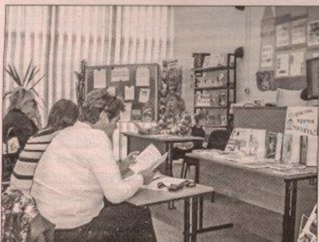
■ При проведении семинара «Роль библиотек в профилактике асоциальных явлений в подростковой среде» автор статьи напомнила, насколько важно повышать правовую грамотность юных граждан. Ведь зачастую жизнь бывает далеко не так идеальна, как они себе представляют

Хороший эффект даёт «Библиотурне» по учреждениям района с проведением мастер-классов по формированию библиотечного пространства для детей, индивидуальной работе с читателями, анкетированию.